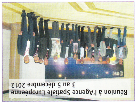
Réunion à l'Agence Spatiale Européenne 3 au 5 décembre 2012

Le SEMIDE poursuit sa collaboration avec l'Agence Spatiale Européenne, avec un atelier de formation pour les Pays du Sud de la Méditerranée organisé du 3 au 5 décembre à Frascati près de Rome. Les thèmes choisis pour cette formation sont : l'accès aux données issues de l'observation de la Terre, l'exploitation des données pour identifier les Masses d'Eau, les inondations, l'utilisation du sol, l'évaluation de l'évapotranspiration, des modifications des Masses d'Eau souterraines.